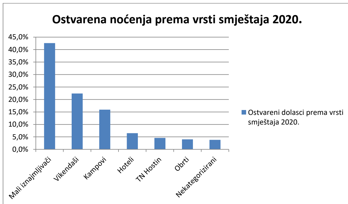
Tablica 4. Ostvarena noćenja prema vrsti smještaja za 2020. Godinu

Kao i svih dosadašnjih godina, kada je vrsta smještaja u pitanju, prednjači mali obiteljski smještaj koji je ostvario 42,6% ukupnih noćenja u 2020. Godinu. Kampovi u Tisnom su ostvarili 15,9% svih noćenja, vikend objekti 22,4 %, hoteli 6,5%, TN Hostin (aprtmani i kamp) 4,6%, obrti 4 % te nekategorizirani objekti 3,8%.